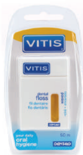
VITIS® waxed dental floss круглая, вощеная 50м