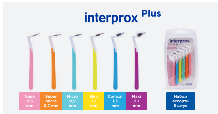
Nano 0,6 mm Super micro 0,7 mm Micro 0,9 mm Mini 1,1 mm Conical 1,3 mm Maxi 2,1 mm