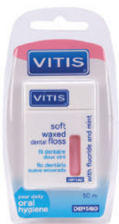
VITIS® waxed dental floss круглая, вощеная со фтором и мятой, 50м