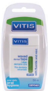
VITIS® waxed dental tape плоская, вощеная со фтором и мятой, 50м

Зубные нити VITIS® изготовлены из высококачественного нейлона и покрыты воском для наилучшего проникновения в узкие межзубные промежутки. Каждая нитка упакована в индивидуальный бокс, исключающий загрязнение находящейся внутри нити. Нити VITIS® имеют две формы плетения: плоская - для наилучшего проникновения в узкие межзубные промежутки, и круглая - для людей, имеющих широкие просветы между зубами.