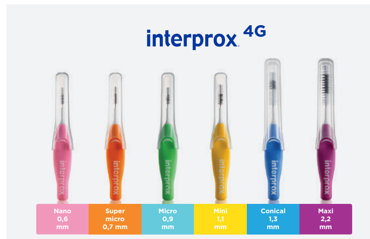
Nano 0,6 mm Super micro 0,7 mm Micro 0,9 mm Mini 1,1 mm Conical 1,3 mm Maxi 2,2 mm

Мягкая ручка с двумя точками изгиба, поворот на 360° Проволока по всей длине ершика Защитный колпачек может удлинять ручку